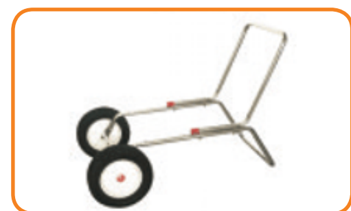
Mulighed for tilkøb af hjulsæt